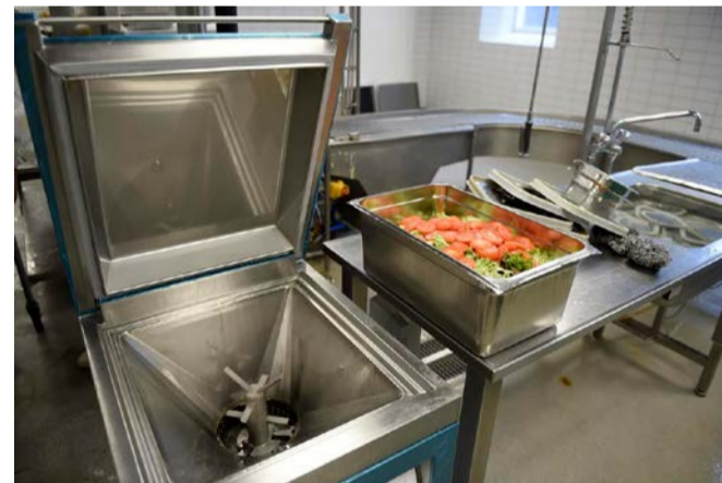
★ Kværnen, som den ser ud.